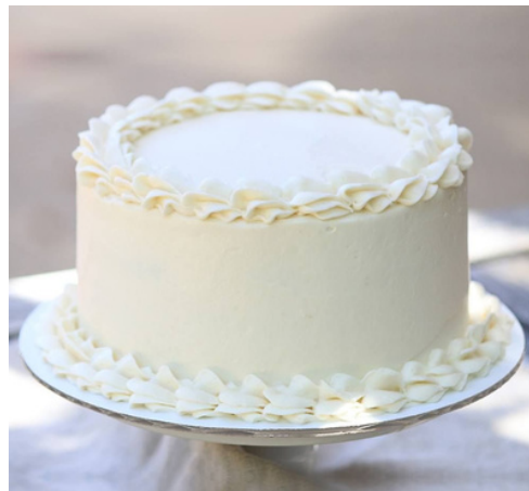
2: Decorated white