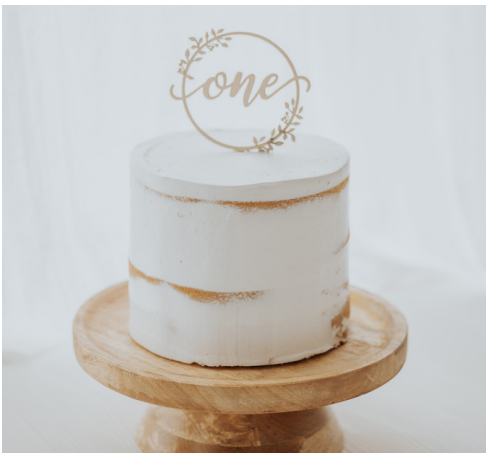
1: Naked cake

Laat het me zeker weten! Ik kan je dan laten weten of er eventuele extra kosten zijn voor het maken van de taart of niet.