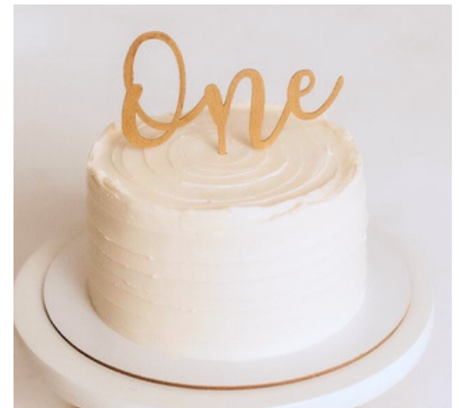
3: White cake