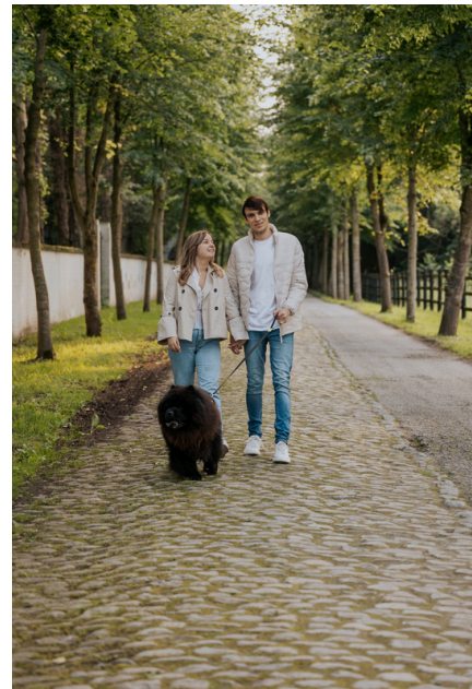
LOCATIE 2: GERAARDSBERGEN