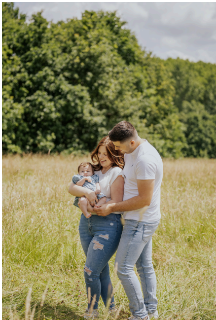
LOCATIE 1: SINT-MARIA-LOUDENHOVE

Natuurlijk weet ik zelf ook enkele pareltjes zijn. Spreekt één van deze locaties je aan? Laat maar weten!